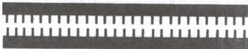
Fig. 1. ADN – 2 catene compuse din nucleotide cu o anumită consecutivitate.

Cromozomul bacterian , spre deosebire de cromozomii eucariotelor, reprezintă o moleculă de ADN circulară. ADN-ul (nucleoidul) bacterian are masa moleculară de circa 2 \times 10^9 kDa și conține până la 4 mii gene necesare pentru menținerea viabilității bacteriilor și multiplicării lor. Pe lângă cromozomul (nucleoidul) bacterian, unele bacterii posedă elemente genetice extracromozomiale – plasmide, transpozoni și IS (segmente insertante) succesivități, care la fel sunt reprezentate de molecule ADN, deosebindu-se unele de altele prin masa moleculară, volumul informației codificate, capacitatea replicării autonome și alte particularități. Elementele genetice extracromozomiale nu au importanță vitală pentru celulă, deoarece nu conțin informație despre sinteza enzimelor ce participă în metabolismul plastic și energetic. Cu toate acestea, ele pot conferi bacteriilor unele proprietăți selective, cum ar fi rezistența la antibiotice sau factorii de patogenitate.