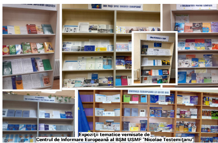
Expoziții tematice vernisate de Centrul de Informare Europeană al BSM USMF "Nicolae Testemițanu"