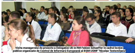
Visita managerului de proiecte a Delegației UE în RM Fabien Schaeffer în cadrul lecțiilor publice organizate de Centrul de Informare Europeană al BSM USMF "Nicolae Testemițanu"