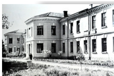
1945. Clădirea în care se afla Biblioteca

Biblioteca a fost fondată la 20 octombrie 1945, odată cu întemeierea USMF „Nicolae Testemițanu”, constituită în baza Institutului de Medicină nr. 1, a Institutului de Medicină nr. 2, Institutului de Pediatrie din Leningrad (astăzi Sankt Petersburg) și a reprezentanților altor instituții de profil din Federația Rusă, care au fost evacuați în timpul celui de-al Doilea Război Mondial la Kislovodsk și ulterior transferați în RSSM, împreună cu studenții și întreg corpul didactic, fiind fondat Institutul de Stat de Medicină din Chișinău (ISMC).