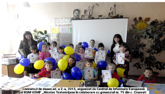
Concursul de desen ed. a 2-a, 2015, organizat de Centrul de Informare Europeană al BSM USMF "Nicolae Testemițanu" în colaborare cu gimnaziul nr. 75 din c. Cruzești