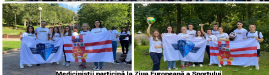
Medicinistii participă la Ziua Europeană a Sportului