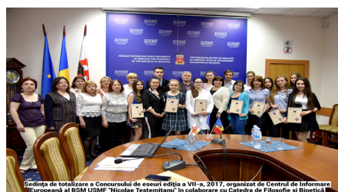
Sedința de totalizare a Concursului de eseuri ediția a VII-a, 2017, organizat de Centrul de Informare Europeană al BSM USMF "Nicolae Testemițanu" în colaborare cu Catedra de Filosofie și Bioetică